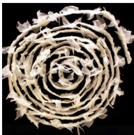
Triennale 2008 - Lydia Predominato