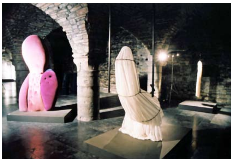
La Crypte de l'Hôtel de Ville - Triennale 2001 - Tom Zwerver