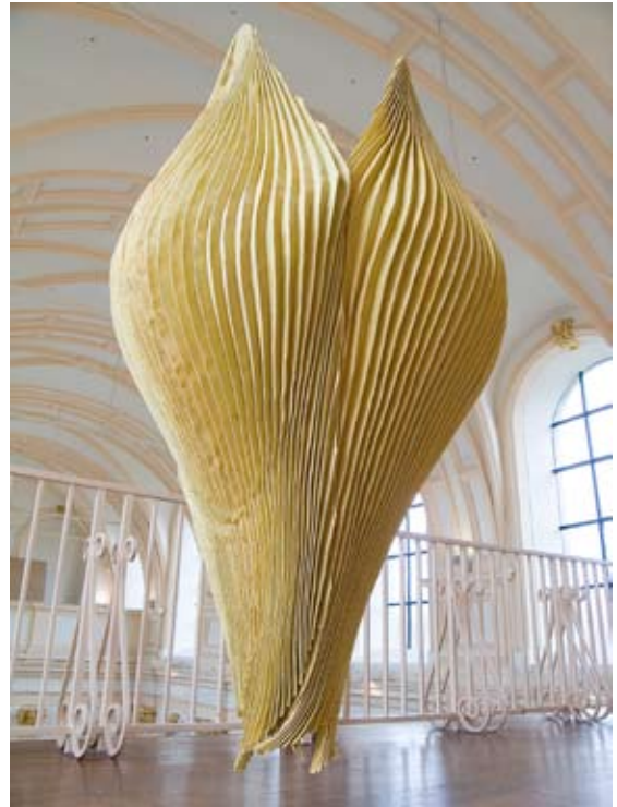
Site de Choiseul - 2005 - Yuka Kawai