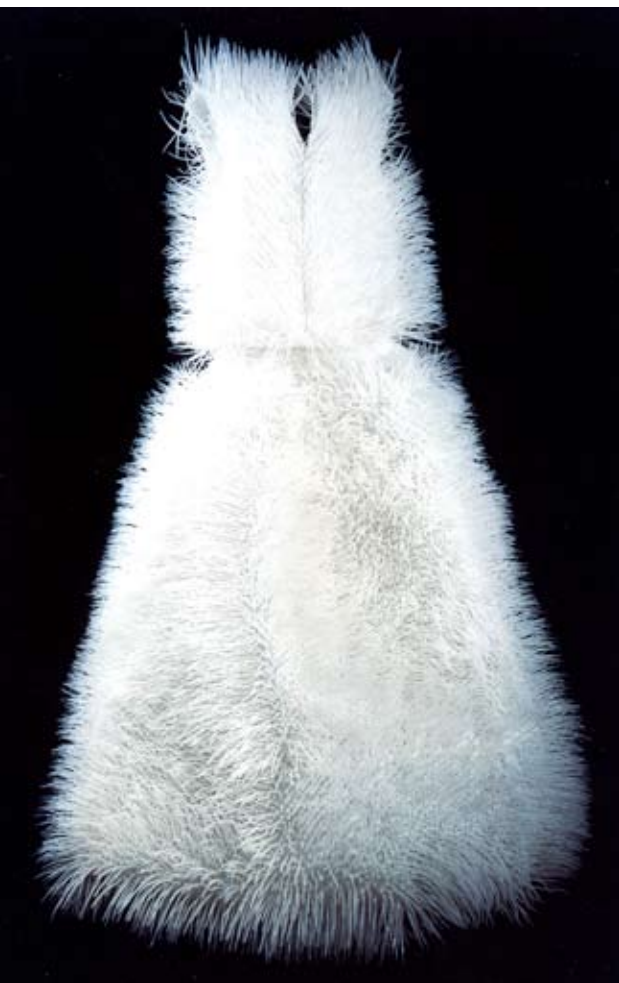
Musée de la Tapisserie - 2005 - Lucia Flego