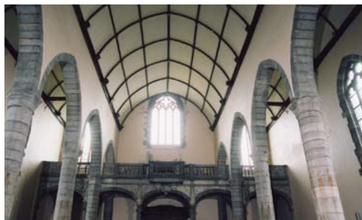
Eglise du Séminaire épiscopal