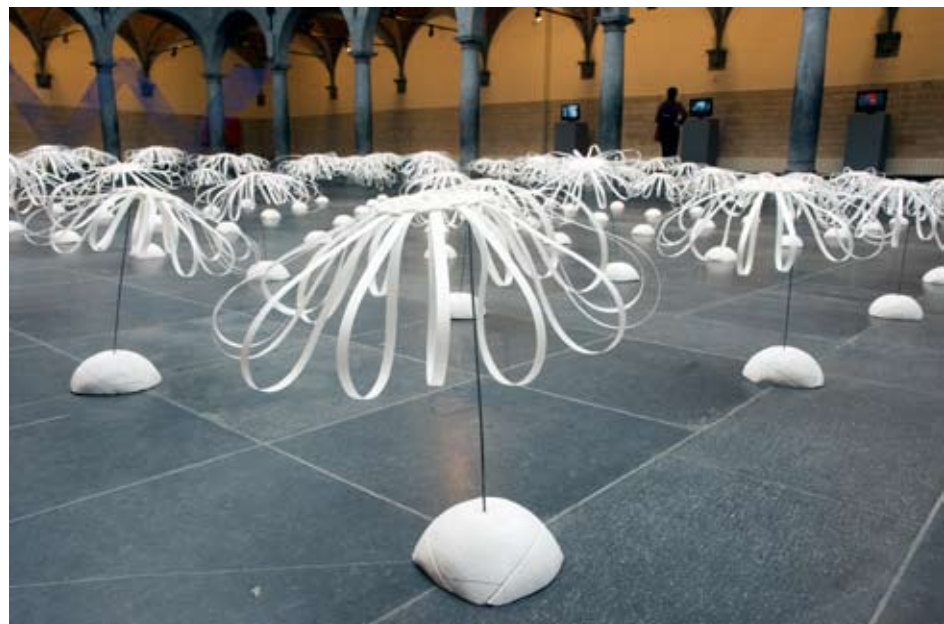
Halle-aux-Draps - 2008 - Laura Facchini