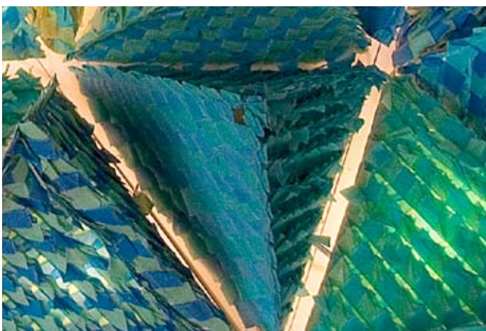
Triennale 2005 - Yuko Takada Keller (détail)