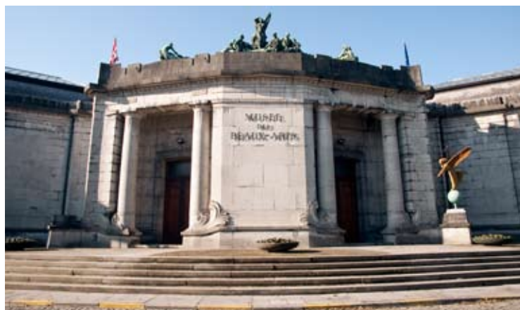
Façade du Musée des Beaux-Arts de Tournai - Architecte Victor Horta