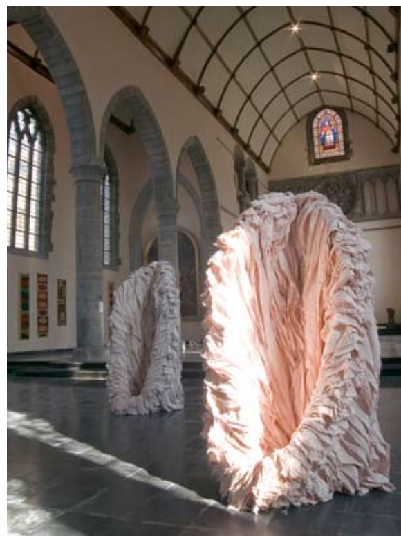
Eglise du Séminaire épiscopal - Triennale 2005 Kiyonori Shimada

C'est aussi le produit d'une convergence de points de vue entre les nombreuses institutions sans lesquelles le projet ne peut se réaliser: l'Intercommunale Ideta, la Chambre du Commerce et de l'Industrie, le Choq (Centre de la Wallonie picarde pour la Qualité) et des partenaires privés.