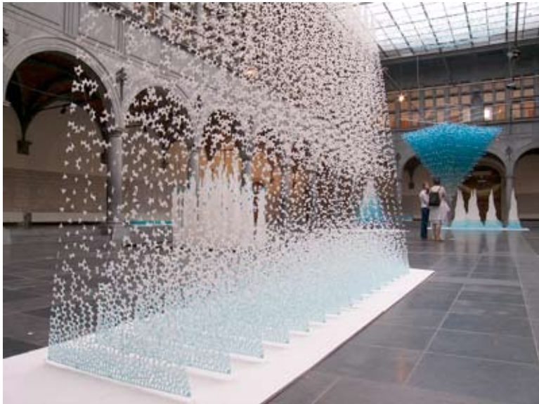
Halle-aux-Draps - 2005 - Yuko Takada Keller